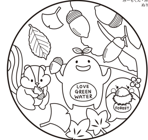
イニシャルまたはペンネーム みーもくん・みーなちゃんの ぬりえ

ピングocard 自作でもOK! 友人やグループで素材集めを楽しむなら「フィールドピング」がおすす。自然と触れ合いながらゲーム感覚で素材を採取することができますよ!また、市販のカードのみならず、自分たちでカードを作って楽しめるのも「フィールドピング」のおもしろポイント!